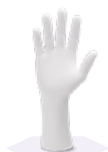
Стерильные нитриловые перчатки Kimtech™ G3 белого цвета