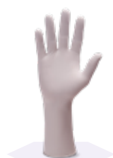
Нитриловые перчатки Kimtech™ G3 и G5 Sterling™