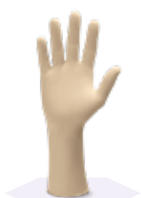
Стерильные латексные перчатки Kimtech™ G3