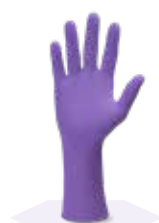
Фиолетовые нитриловые перчатки Kimtech™ Nitrile™ Xtra™